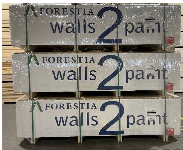
Ny emballering med papp