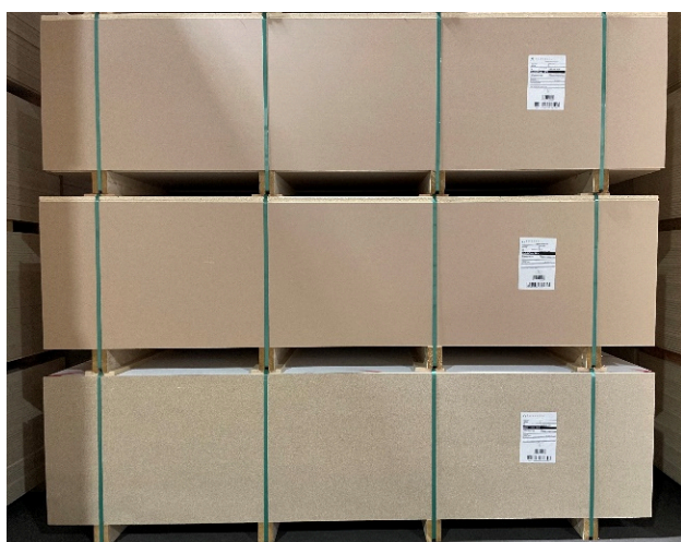
Oprinnelig emballering med spon

Vi har i 2023 gjennomført dette for Walls2Paint. Dette prosjektet reduserer ca. 650 tonn transportvekt pr. år og dette gir samtidig den samme reduksjonen i avfall på byggeplass. Denne reduksjonen i emballasje resulterer i at utslippet relatert til transport reduseres med ca. 11 tonn CO 2 -ekv. på årsbasis.